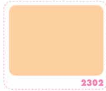
สีส้มทิวลิป TULIP ORANGE