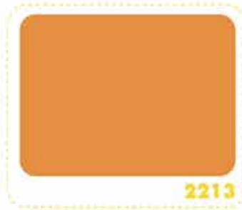
สีเหลืองส้ม ORANGE YELLOW