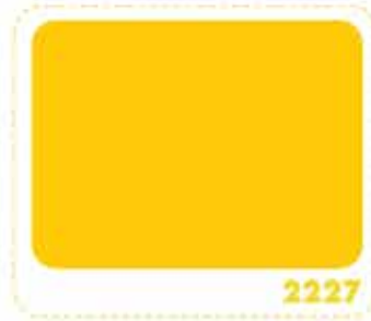
สีเหลืองดาวเรือง MARIGOLD