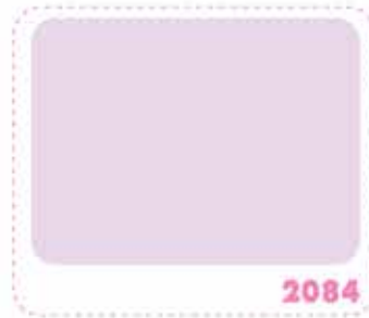
สีม่วงอ่อน LIGHT VIOLET