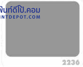
สีเทากวพา MOUNTAIN GRAY