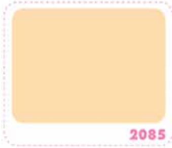
สีครีมแอพริคอต APRICOT CREAM