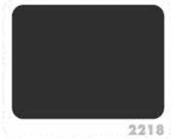
สีดำด้าน FLAT BLACK