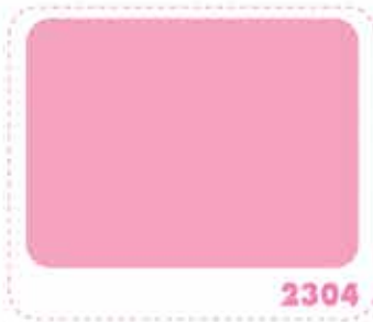
สีชมพูทอแสง DAWN PINK