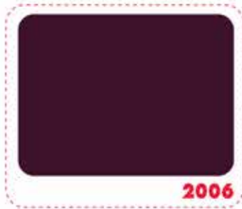
สีแดงมารูน MAROON