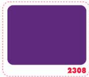
สีม่วงอชุ่น GRAPE VIOLET