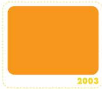
สีเหลืองทอง GOLDEN YELLOW