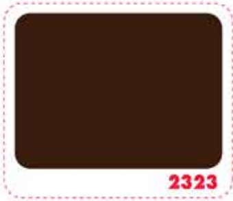
สีน้ำตาลเข้ม DARK BROWN