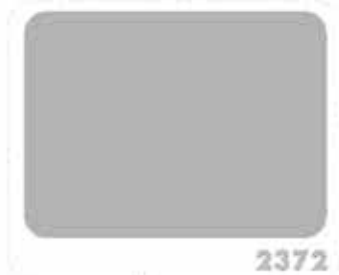
สีควันบุหรี่ SMOKY