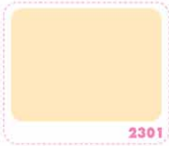
สีเหลืองแพรไหม SILK YELLOW