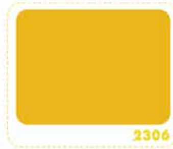
สีเหลืองเลมอน LEMON YELLOW