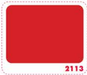
สีแดงซิกแนล SIGNAL RED