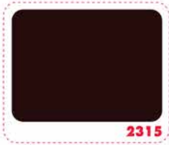
สีน้ำตาล BROWN