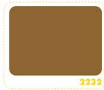
สีเหลืองออกไซด์ OXIDE YELLOW