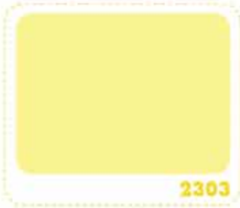
สีเหลืองนาร์ซิส NARCISSUS YELLOW