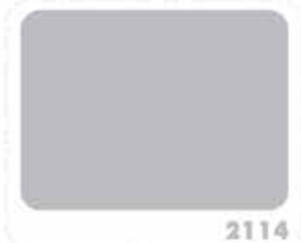
สีบรอนซ์เงิน SILVER