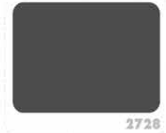
สีเทาดำ BLACK GRAY