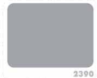
สีเทาน้ำเงิน BLUE GRAY