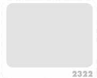
สีเทาหินอ่อน MARBLE GRAY