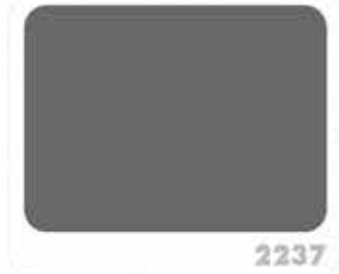
สีเทาเข้ม DEEP GRAY