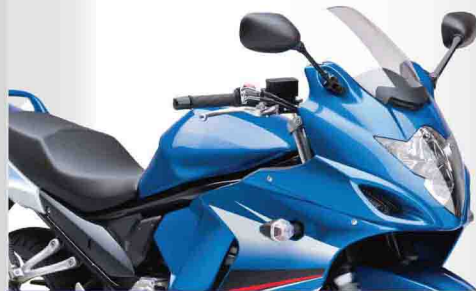
รถจักรยานยนต์ Motorcycle