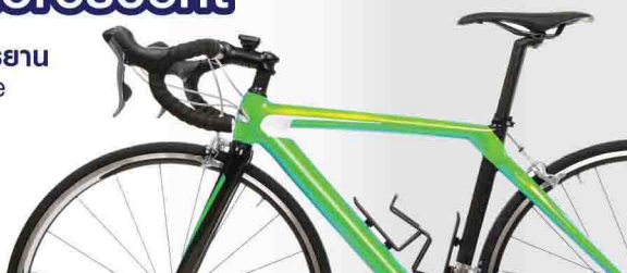
รถจักรยาน Bicycle