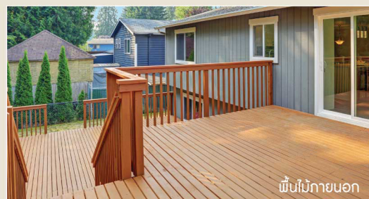
พื้นไม้ภายนอก

เมื่อทา SHARK WOODSTAIN PLUS ตามเฉดสีที่ต้องการแล้ว ควรทาทับด้วย SHARK WOODSTAIN PLUS #M3900 อีกครั้ง เพื่อเพิ่มความทนทาน และทนรอยขีดข่วน