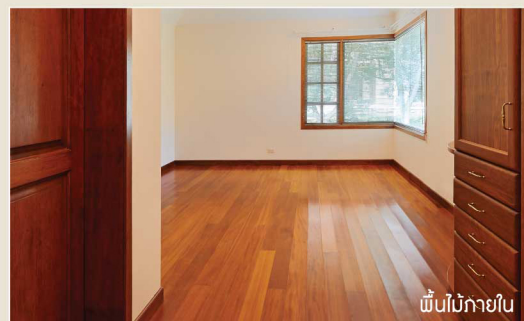
พื้นไม้ภายใน