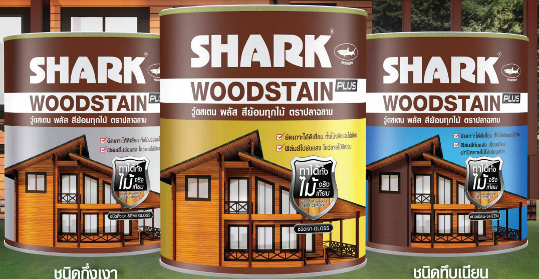
ชนิดกึ่งเงา