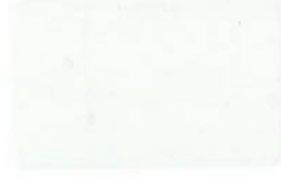
010 -NEW- Lavender White