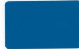
372 -NEW- River Blue