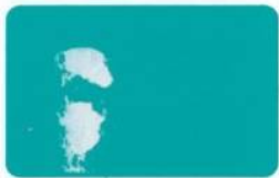
412 Ski Blue