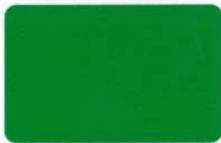
501 Palm Spring