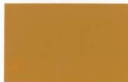
6120 Zinc Chromate Primer Yellow สีรองพื้นกันสนิมซิงค์โครเมต