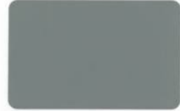
708 Ash Grey