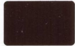
212 Ruby Red