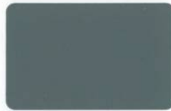
711 Silver Grey