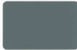
684 -NEW- Pastel Grey