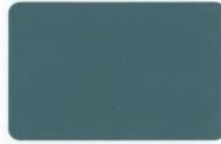
710 Dove Grey