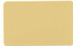
610 Sugar Cream