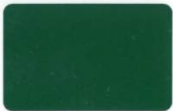
519 Dark Green