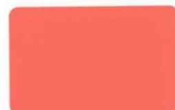
207 Coral Flower