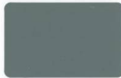
709 Light Grey