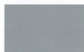
Aluminium Wood Primer สีรองพื้นไม้อลูมิเนียม