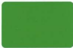
511 Bright Green