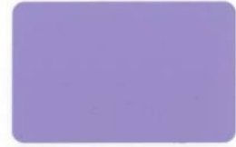
107 Royal Purple