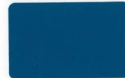
414 Regal Blue