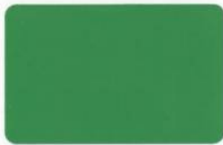
516 Apple Green