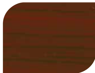
สีแดง - Pyinkado #7906