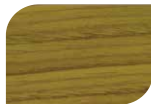
กับด้วย สีสด้าน #8000