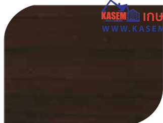
สีม่วงแอมมิติสต์ Amethyst Violet #7912