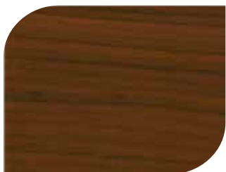
สีประดู่ - Padauk #7905