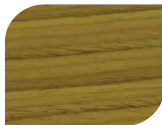
สีใสประกายมุก #7990 Pearl Clear