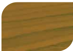
กับด้วย สีสด้าน #8000