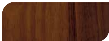
กาสีย้อมไม้ เจบีพี วูดสเตน 3 เที่ยว

แสดงจำนวนเที่ยว ที่ทาบนพื้นผิวไม้โดยใช้สีย้อมไม้