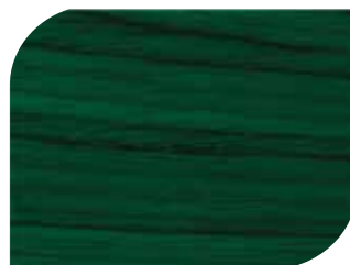
สีเขียวมรกต Jade Green #7910