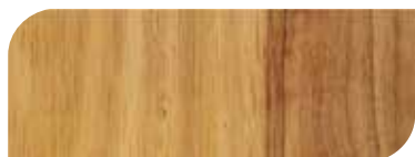
กาสีย้อมไม้ เจบีพี วูดสเตน 1 เที่ยว