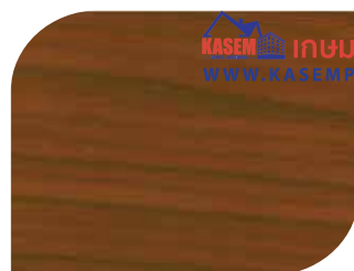
สีมะฮอกกานี #7908 Mahogany