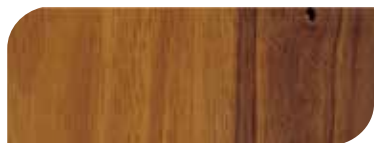
กาสีย้อมไม้ เจบีพี วูดสเตน 2 เที่ยว