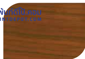
กับด้วย สีสด้าน #8000