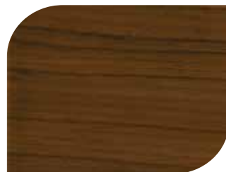
สีมะค่า - Sindora #7902