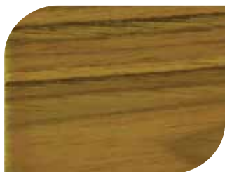
สีสักทอง #7901 Golden Teak

KASEM เพ้นท์ดีโป.คอม WWW.KASEMPAINTDEPOT.COM