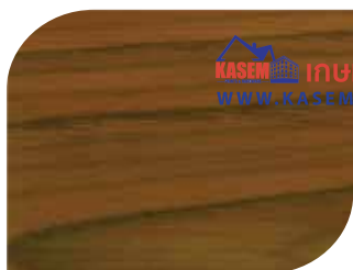
สีสัก - Teak #7903