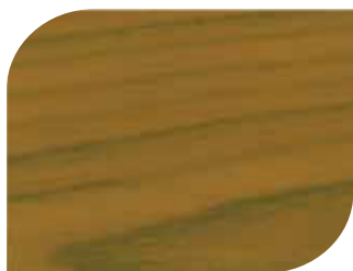
สีเหลืองมรกต #7911 Topaz Yellow