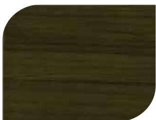
สีเหวกลือ - Ebony #7907