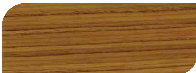
สีใสด้าน - Clear Matt #8000

ให้งานไม้ คงทนสวยงาม ดูเป็นธรรมชาติ เพื่อสร้างความคลาสสิกและ เรียบหรูด้วย สีย้อมไม้ชนิดด้าน