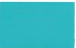
● CE 3-30-4 Still Tide Water