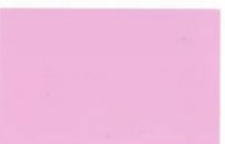
● CE 2-45-3 Almond Blossom