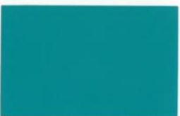
● CE 3-30-5 Tropical Sea