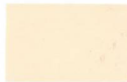
● CE 2-6-2 Peach Pinch