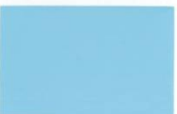
● CE 3-33-3 Baby Blue