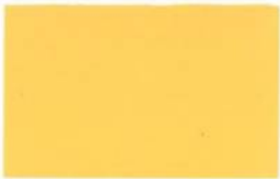
● CE 1-8-4 Fairy Gold