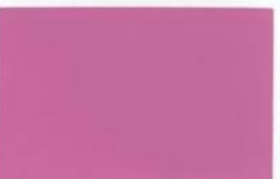
● CE 2-45-5 Pink Delight