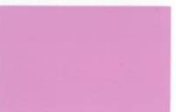
● CE 2-45-4 Pink Bells