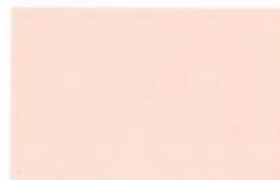
● CE 1-1-2 Fetching Pink