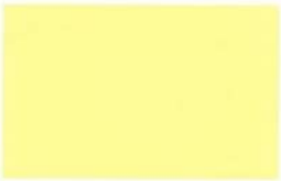
● CE 1-10-2 Parmesan