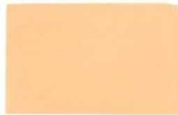
● CE 2-6-3 Carotene