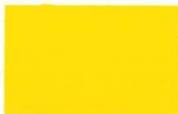
● CE 1-10-5 Lemon