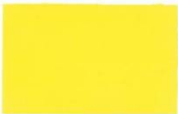
● CE 1-10-4 Bumble Bee