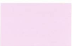
● CE 2-45-2 Veiled Rose