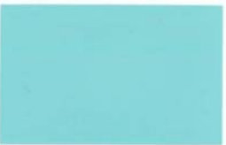
● CE 3-30-3 Rain Song