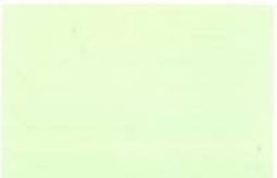
● CE 2-18-2 Green Myth