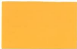
● CE 1-8-5 Mandarin