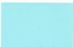
● CE 3-30-2 Hidden Mirage